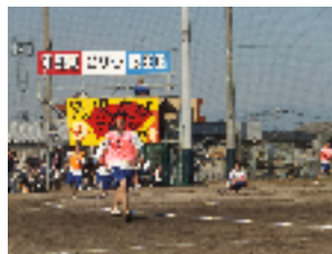
ブロック対抗リレー