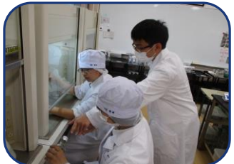
バイオテクノロジー